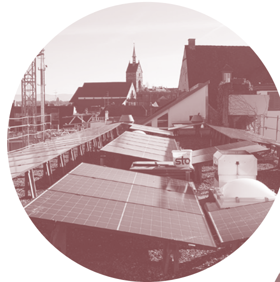
Baustelle der Dachsanierung und Photovoltaikanlage