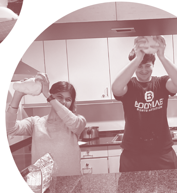
Teig kneten für den Grätimänner-Abend