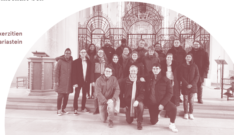
Kurzexerzitien im Kloster Mariastein